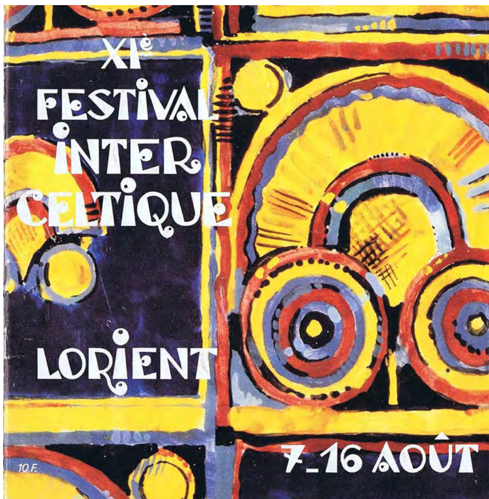
XI e festival interceltique Lorient Programme 1981 Médiathèque Festival Interceltique de Lorient, Lorient

VENDREDI 13 MAI À 12H30 : Concert de NOON