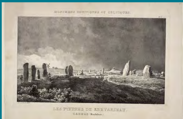
Jean-Baptiste Jorand, Les pierres de Kervarieau, estampe, 1823, coll. Musée de Bretagne, marque du domaine public

Le celtisme, l'ensemble des connaissances liées aux Celtes, longtemps investi uniquement par les lettrés et les intellectuels, se popularise progressivement au 20 e siècle avant de gagner largement la société contemporaine par le domaine culturel.