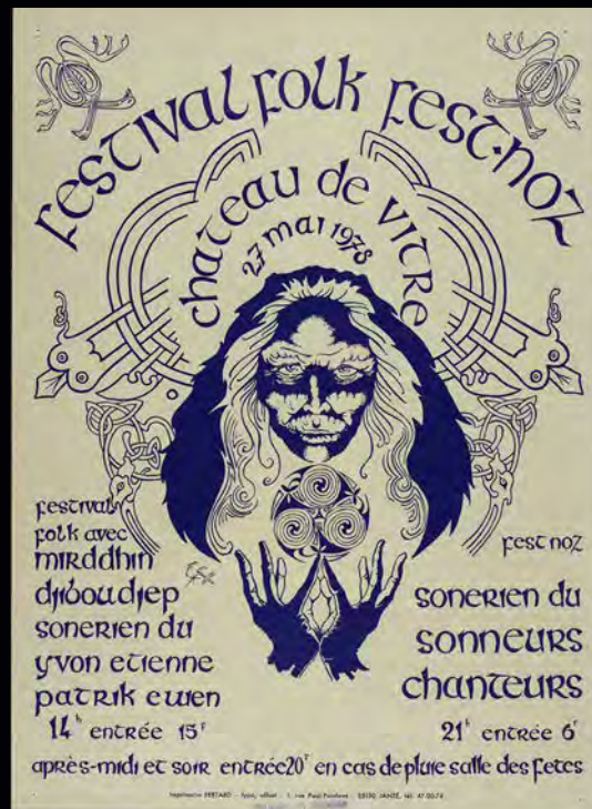
Festival folk, château de Vitre, affiche, Imprimerie Fertard, 1978, coll. Musée de Bretagne, CC BY NC ND

Aujourd'hui encore, la référence à certaines traditions populaires accompagne des affirmations identitaires, notamment dans un contexte de mondialisation. L'important est d'en être conscient : on se construit sur des identités multiples, croisements de constructions intellectuelles et d'imaginaires.