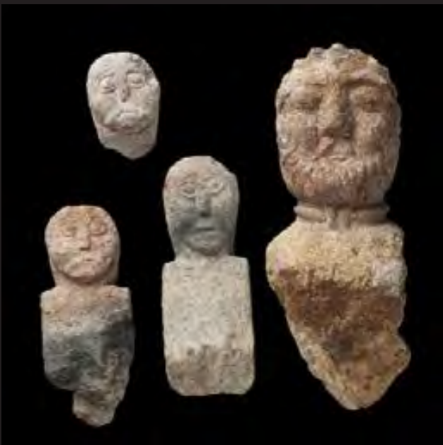
Ensemble des bustes découvert à Trémuson (22), 2 de moitié du 2 e siècle av. JC, collection privée, © E. Collado, INRAP

Il n'existe en effet à ce jour qu'une trentaine d'œuvres de ce type connue pour la Gaule dont 13 ont été découvertes en Bretagne. Dans cette même région, seulement deux sites ont bénéficié d'une découverte dans un environnement archéologique préservé : à Paule en 1988 et à Trémuson en 2019.