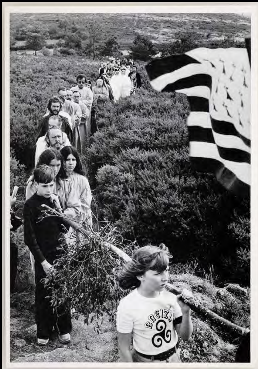
Druïdes au Mané-Guen, Guénin (56), carte postale, août 1975, coll. Musée de Bretagne, @ Gaby Le Cam