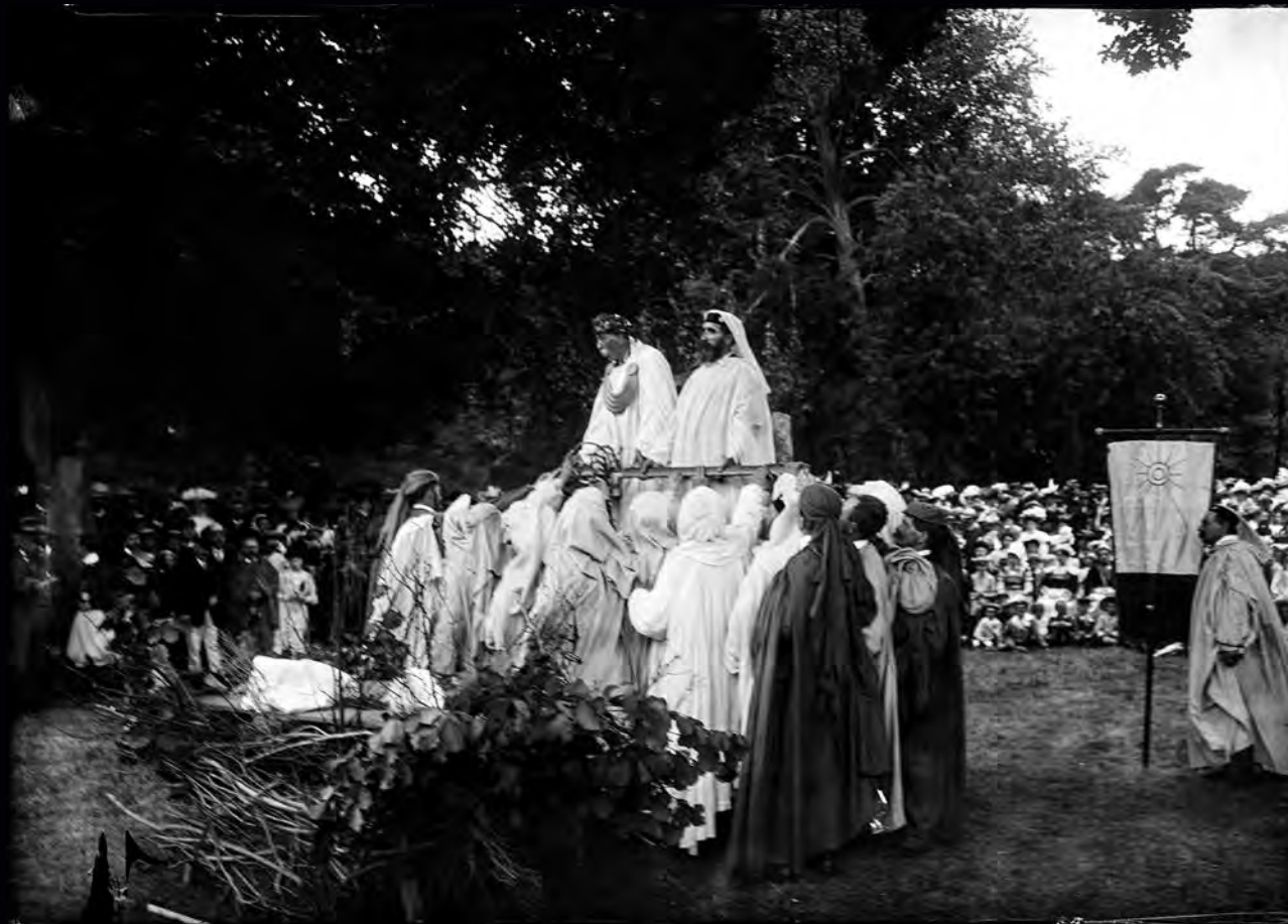
Rassemblement de druides, négatif sur verre, 22 juillet 1906, coll. Musée de Bretagne, marque du domaine public