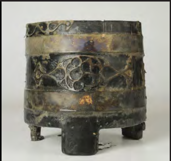
Seau, découvert à Trémuson (22), 2 de moitié du 2 e siècle av. JC, collection privée, © E. Collado, INRAP