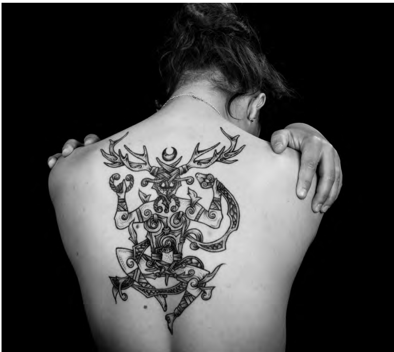
Alexandra, Cernunnos (tatoueur : Jaheel), photo A. Amet, coll. Musée de Bretagne, CC BY SA

L'ensemble du reportage sera progressivement mis en ligne de mars à octobre 2022 sur le portail des collections du Musée de Bretagne ( www.collections.musee-bretagne.fr )