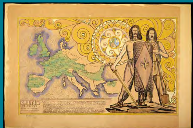
René-Yves Creston, Keltia, les Celtes dans le monde ancien, de l'an 1000 à l'an 6 avant J.-C., lithographie, vers 1947, coll. Musée de Bretagne, @adagp