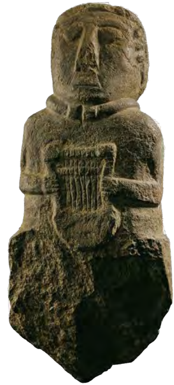
Barde à la lyre, coll. Musée de Bretagne

Si à partir du milieu du 5 e siècle avant J.-C., la péninsule armoricaine est, comme d'autres régions, pleinement intégrée à la culture commune de l'Europe celtique, ce sont les migrations issues de l'actuelle Grande-Bretagne au haut Moyen Âge qui tendront à créer une culture particulière.