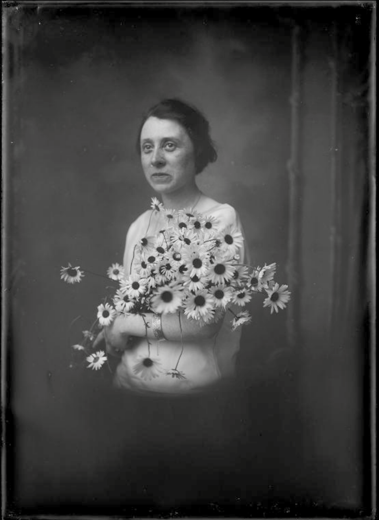
Portrait de femme, négatif sur verre - Henri RAULT. Domaine public.