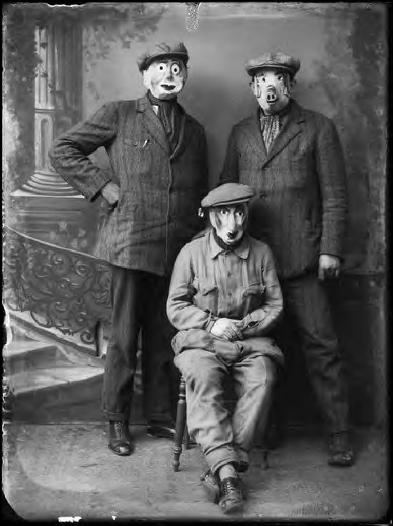
Portrait d'hommes masqués, négatif sur verre - Anne CATHERINE. CC-BY-NC-ND