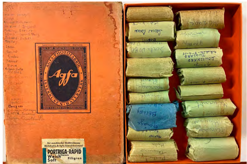
musée de bretagne

L'exposition présente des objets emblématiques du travail de photographes de studio, comme des boîtes de conditionnement de négatifs ou d'archives.