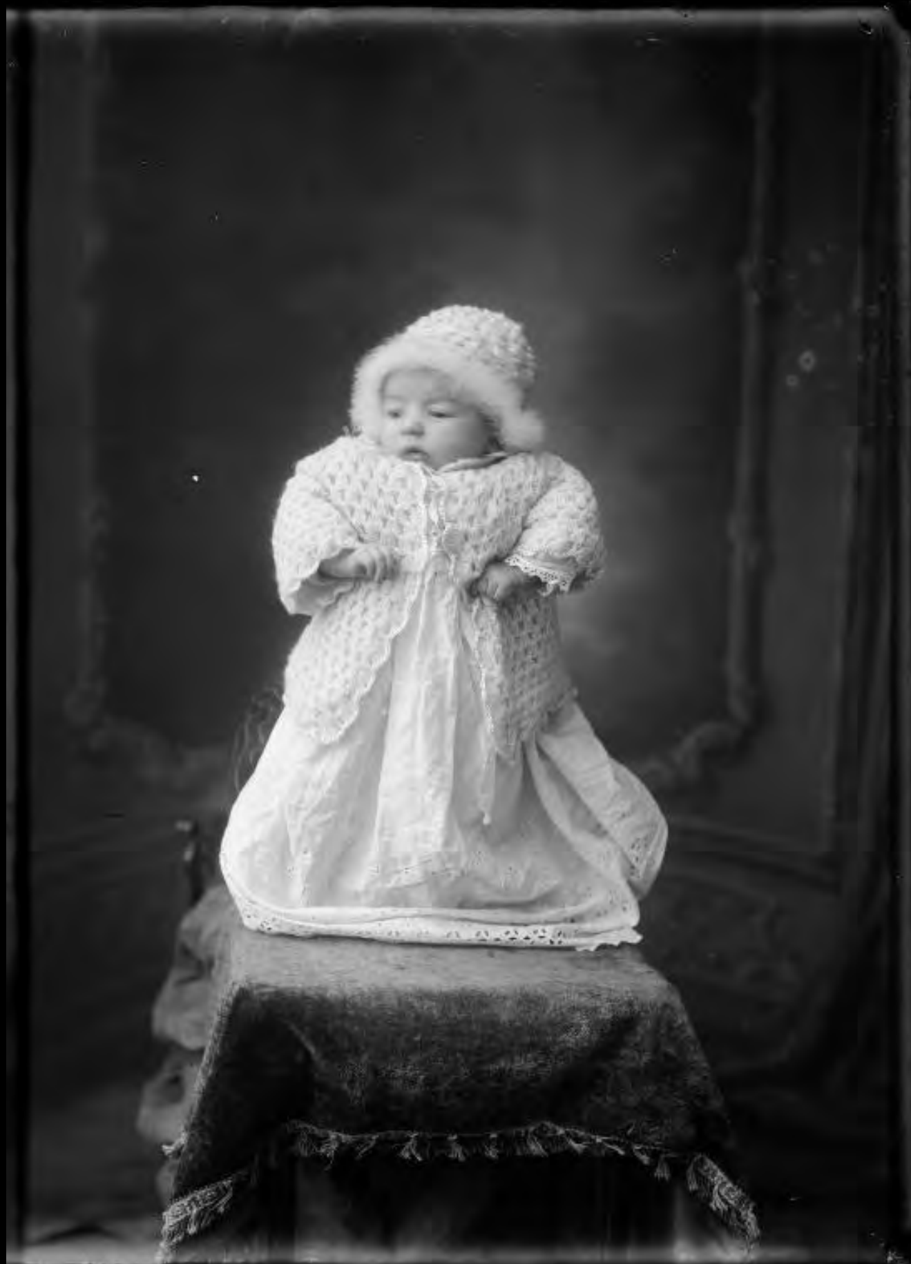
Portrait de bébé, négatif sur verre - Henri RAULT. Domaine public