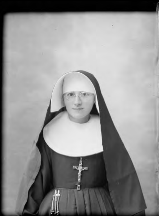
Portrait de religieuse, négatif sur verre - Émile Jacques HOUDUS. CC-BY-SA