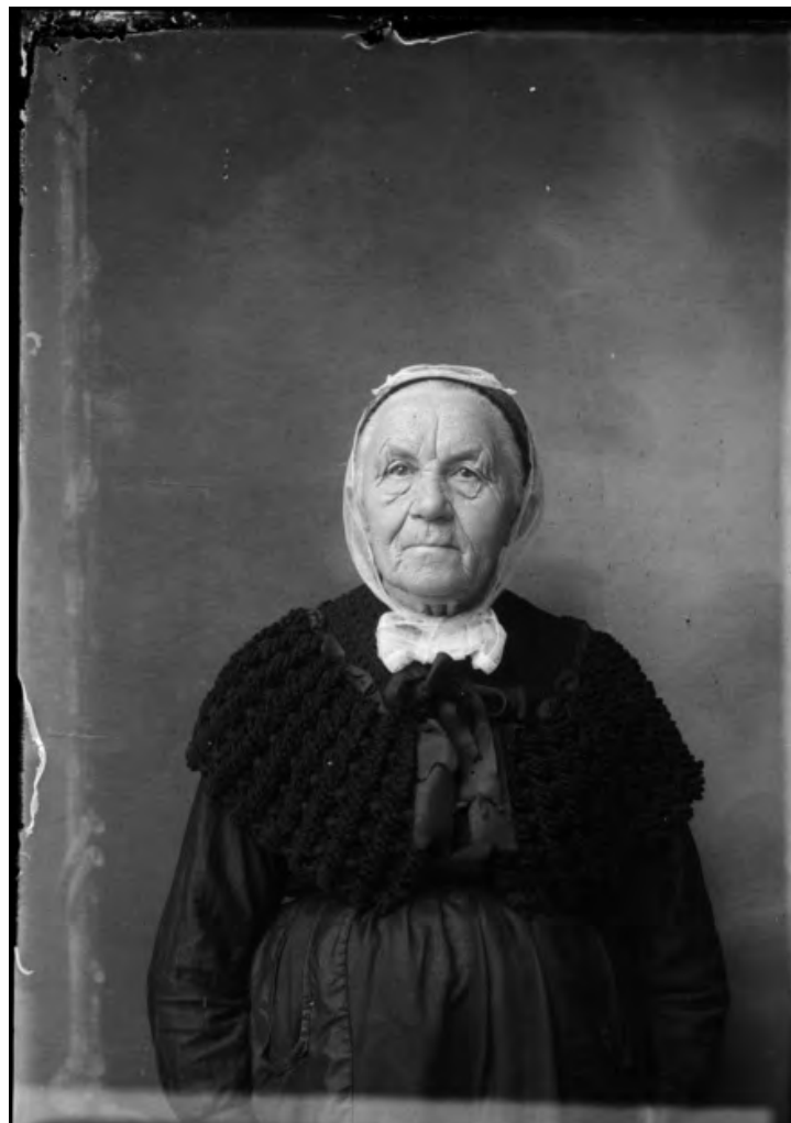
Portrait de femme âgée, négatif sur verre - Henri RAULT. Domaine public

Dans un jeu d'inversion de la vision, ces modèles photographiés semblent regarder le visiteur. Ils nous disent le temps qui passe et la vie qui défile sous le regard du photographe.