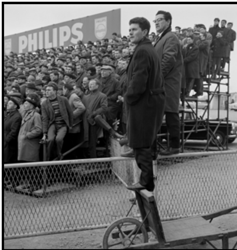
Spectateurs du match Rennes-Valenciennes, Charles Barmay (photographe), 21 février 1965, Rennes (Ille-et-Vilaine), Musée de Bretagne, licence CC-BY-NC.