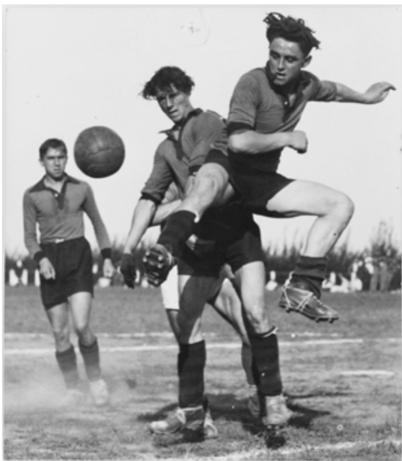
Match de football, anonyme, Lorient (Morbihan), Musée de Bretagne, marque du domaine public.

Ici, c'est l'architecture des lieux qui est valorisée par les photographes.