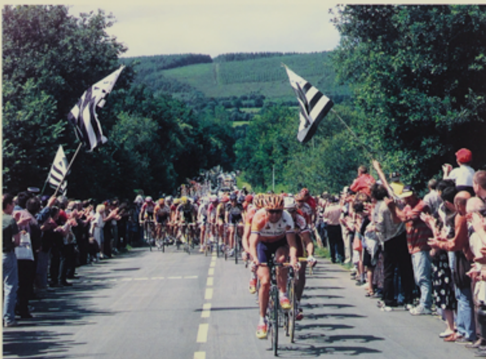
Course cycliste, Saint-Nicolas-du-Pélem (Côtes d'Armor).

Tour de France et autres courses cyclistes, Coupe de France de football, championnats et compétitions diverses... ce qui fait événement attire les objectifs. La photographie se fait le témoin direct d'une actualité sportive qui rythme l'année et les week-ends. Réalisées par un professionnel ou par un amateur, ces photographies ont une valeur à la fois documentaire et historique. Elles transforment l'exploit sportif en un « moment historique » marquant et fédérateur. Des extraits de films issus des collections de la Cinémathèque de Bretagne, nous montrent que, tout comme la photographie, les films amateurs se font le relais de ces événements.