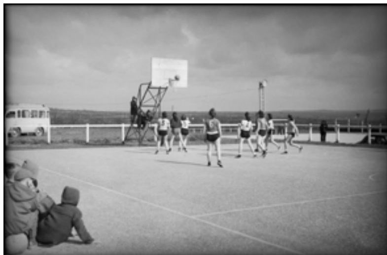
Équipe de basketteuses, Roger Gouriou (photographe), Musée de Bretagne, marque du domaine public.

En sport comme en photographie, on parle d'instant décisif. Ce qui fait la « bonne image », c'est la synchronisation parfaite de deux actions : celle du sportif et celle du photographe. Chacun doit être à sa place, anticiper et accomplir le bon geste au bon moment. Ces images proposent une représentation dynamique du sport tout en figeant les corps en suspension dans l'air, en un arrêt sur image dans des positions insaisissables à l'œil nu et parfois insolites ou cocasses.