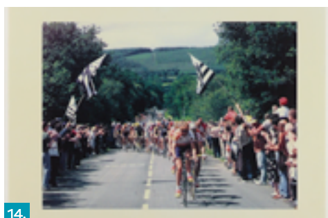
14. Tour de France 1998, Jean-Pierre Prével (photographe), juillet 1998, Musée de Bretagne, licence CC-BY-NC.