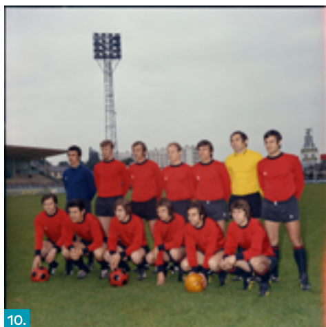
10. Stade rennais, Sigismond Michalowski (photographe), 1971, Musée de Bretagne, licence CC-BY-SA.