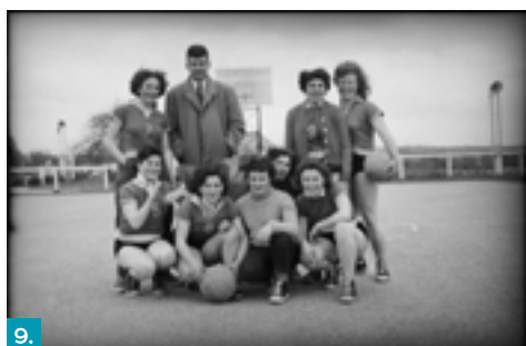
9. Équipe de basketteuses, Roger Gouriou (photographe), Musée de Bretagne, marque du domaine public.