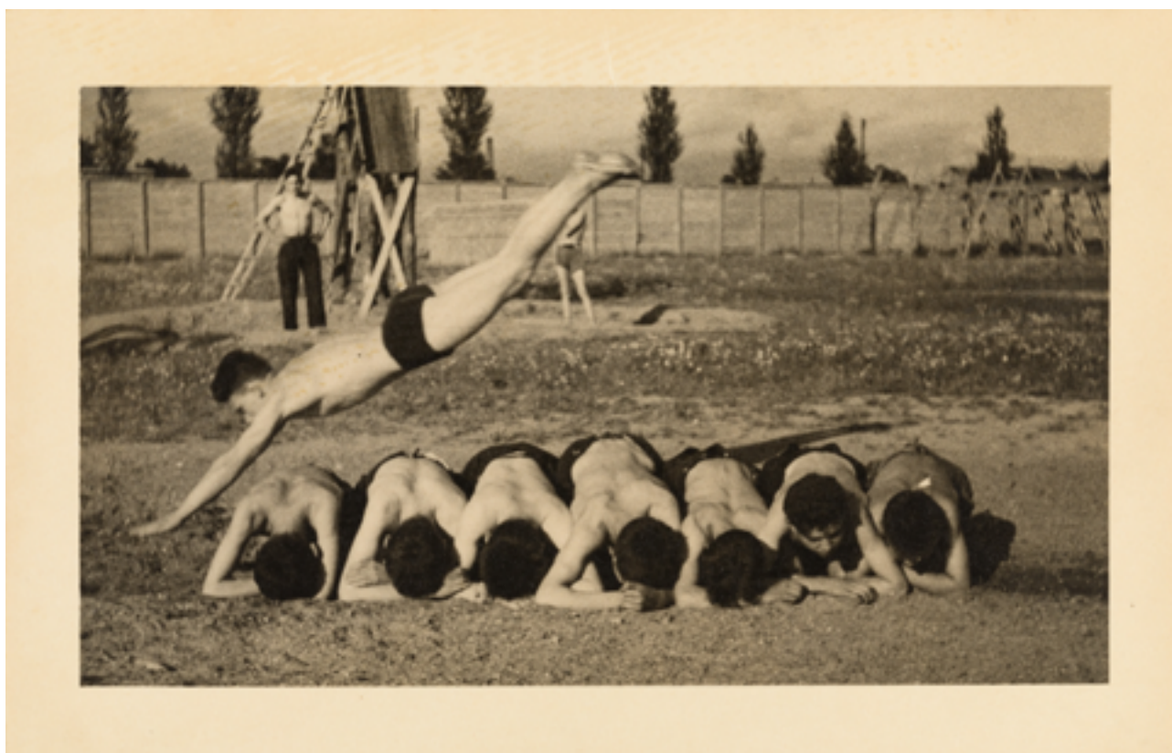
Stade du centre de la Prévalaye, anonyme, juin 1948, Rennes (Ille-et-Vilaine), Musée de Bretagne, marque du domaine public.

et les samedis et dimanches de 14h à 19h.