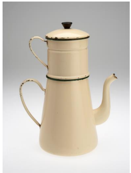
Cafetière Fer, émail, Pipriac (Ille-et-Vilaine)

Cette exposition sera accompagnée prochainement de plusieurs manipulations.