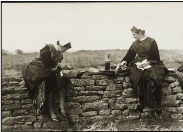
Repas en plein air Carte postale, Raphaël Binet, Lorient (Morbihan), vers 1925

En lien avec : Exposition temporaire « Boire » présentée du 16 octobre 2015 au 30 avril 2016