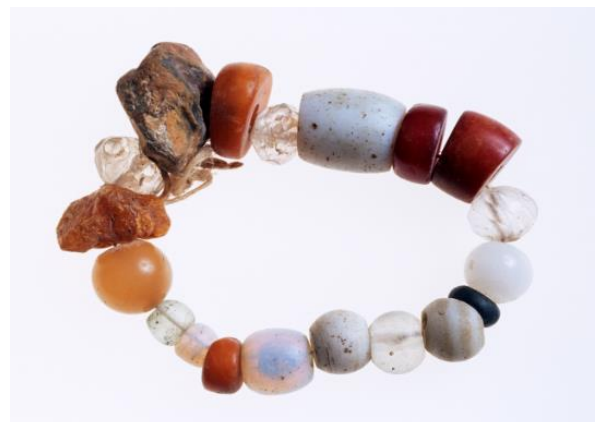
Gougad-patereu Ambre, verre et pâte de verre, Morbihan

Abordant tour à tour les représentations que l'on se fait des sorciers, les rituels d'envoûtements, les dons de guérissons et plein d'autres faits mystérieux, l'exposition J'y crois, j'y crois pas se veut dénuée de tout jugement, offrant à chacun les ingrédients d'une réflexion sur ce domaine de l'étrange.