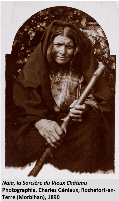
Naïa, la Sorcière du Vieux Château Photographie, Charles Géniaux, Rochefort-en-Terre (Morbihan), 1890

http://www.collections.musee-bretagne.fr/parcours.php?id=musee:MUS_TH_PARCOURS_CONCEPTS:92