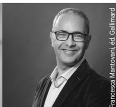
Francesca Mantovani, éd. Gallimard