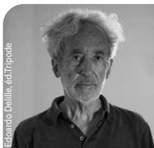
Edoardo Dellile, éd. Tripode

En lien avec l'exposition Son œil dans ma main de Raymond Depardon et Kamel Daoud (jusqu'au 5 janvier).