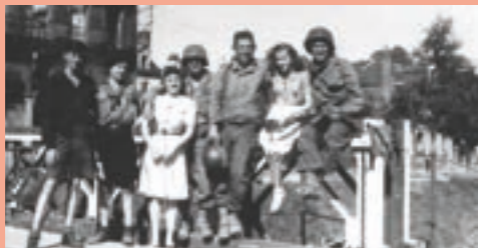
Groupe d'Américains et de Françaises et Français sur le pont de Châteaudun à Rennes, août 1944.

Tout au long du week-end, Les Champs Libres vous invitent à venir à la rencontre d'actrices et d'acteurs qui font vivre et bouger le mariage et le patrimoine.